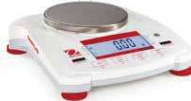
Весы Navigator с круглой грузовой платформой и LED дисплеем

пластмассовый корпус из ABS (акрилонитрил-бутадиенстирол), помогают весам выдерживать годы нормального использования или эксплуатации с нарушением установленных норм или режимов.