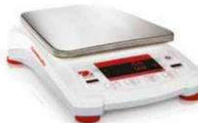
Весы Navigator с прямоугольной грузовой платформой и LED дисплеем