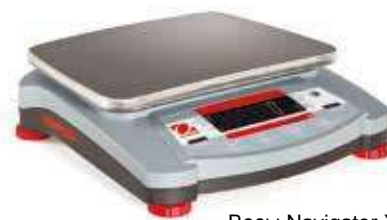
Весы Navigator XT с LED дисплеем