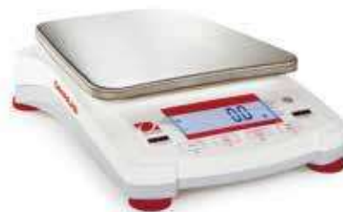
Весы Navigator XL с LCD дисплеем